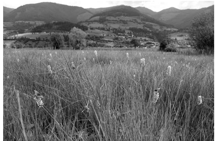
Abb. 2. Flugplatz von Zygaena viciae, Crambus uliginosellus, Deltote uncula und Boloria eunomia im Bereich der Lucialacke in Niedernsill: Nährstoffarme Niedermoorstreuweise.

Plebejus idas (Linnaeus, 1761) (Lycaenidae) – letzter Fund 1949 (Schneiderau)